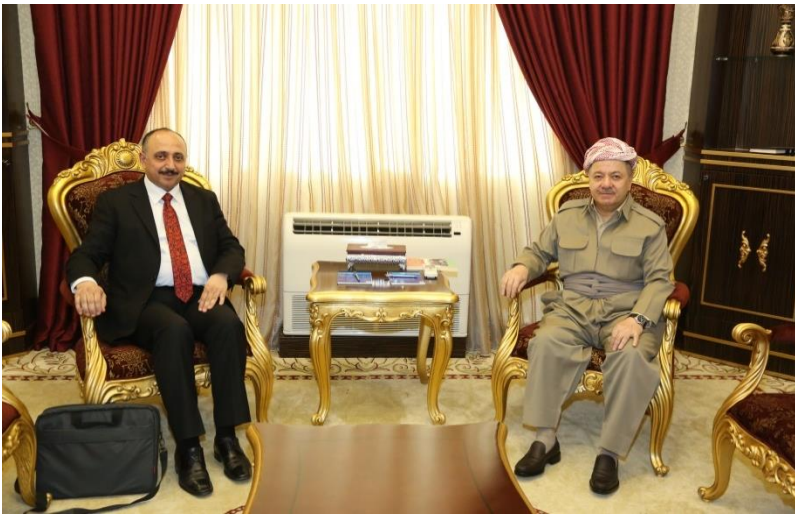
غفور مخموري مع فخامة الرئيس مسعود البارزاني قصر رئاسة كوردستان _ ٢٤ / ٢ / ٢٠١٨