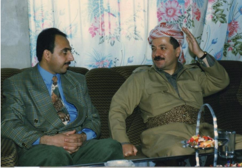
غفور مخموري مع فخامة الرئيس مسعود البارزاني مقر الاتحاد القومي الديمقراطي الكوردستاني YNDK _ ٥ / ٢ / ١٩٩٨