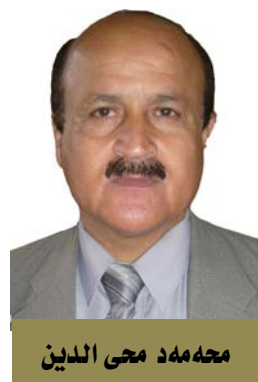
محمدهد مجی اندین